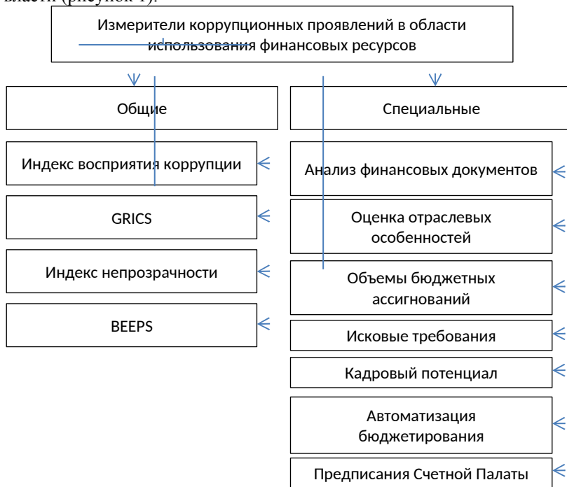
Рисунок 1 – Измерители коррупционных проявлений в области использования финансовых ресурсов органами власти

Одной из сфер, где коррупционные действия получили наибольшее распространение, является использование финансовых ресурсов. В распоряжении должностного лица находится значительный объем финансовых ресурсов, причем данные ресурсы могут быть использованы как к выгоде общества, так и к выгоде определенных лиц. Существуют две группы измерителей коррупционных проявлений в области использования финансовых ресурсов органами власти (рисунок 1).