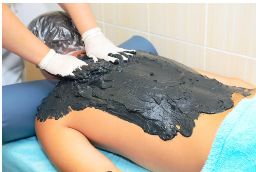
Приложение 6. Минеральные ванны из Дарьинского источника