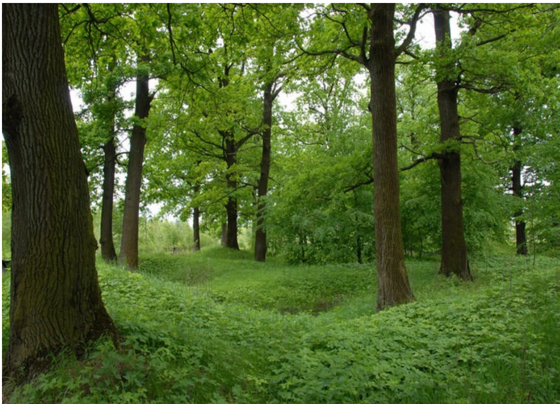
Приложение 5. Применение местных лечебных грязей в санатории «Поречье»