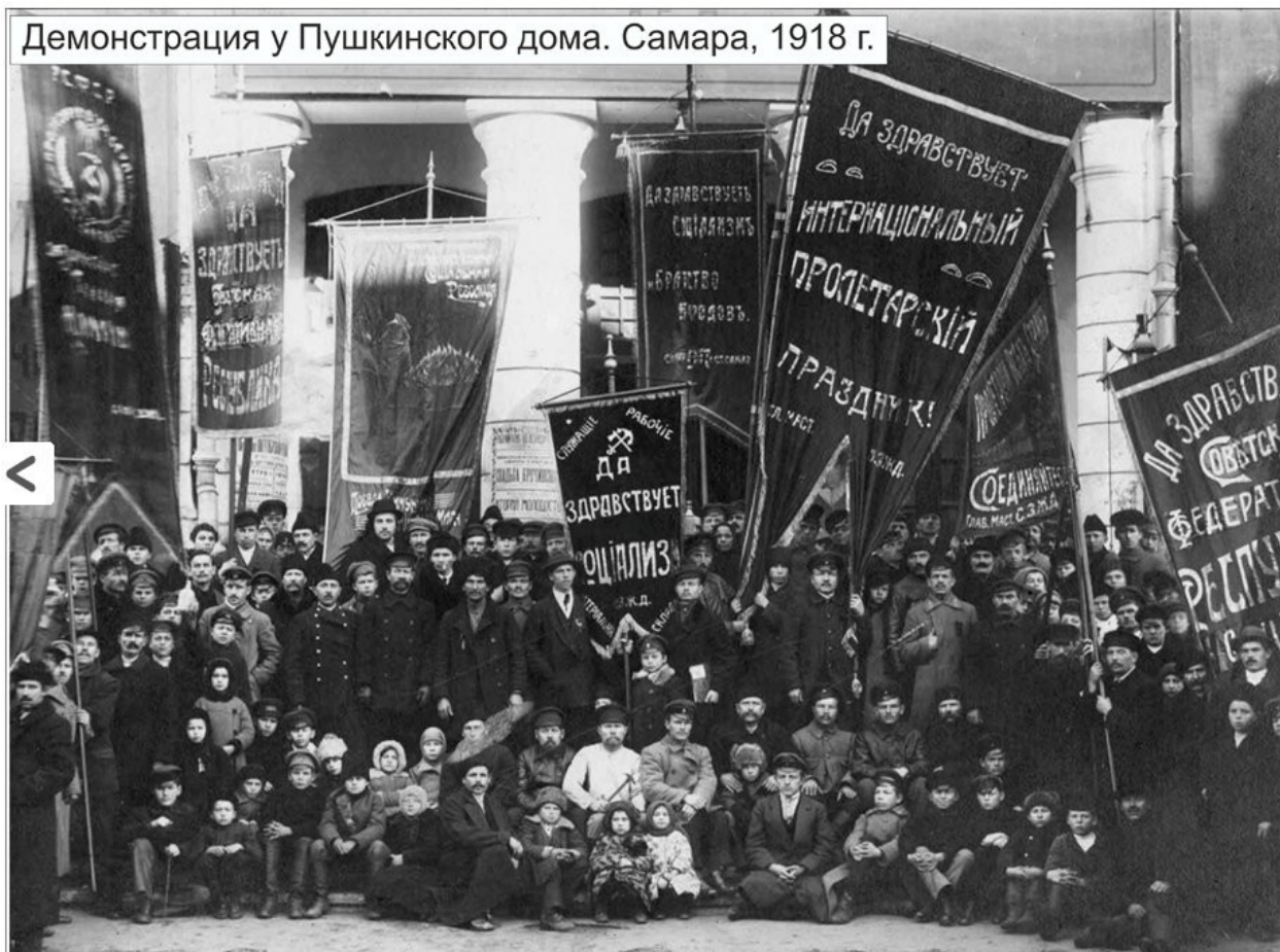
Демонстрация у Пушкинского дома. Самара, 1918 г.