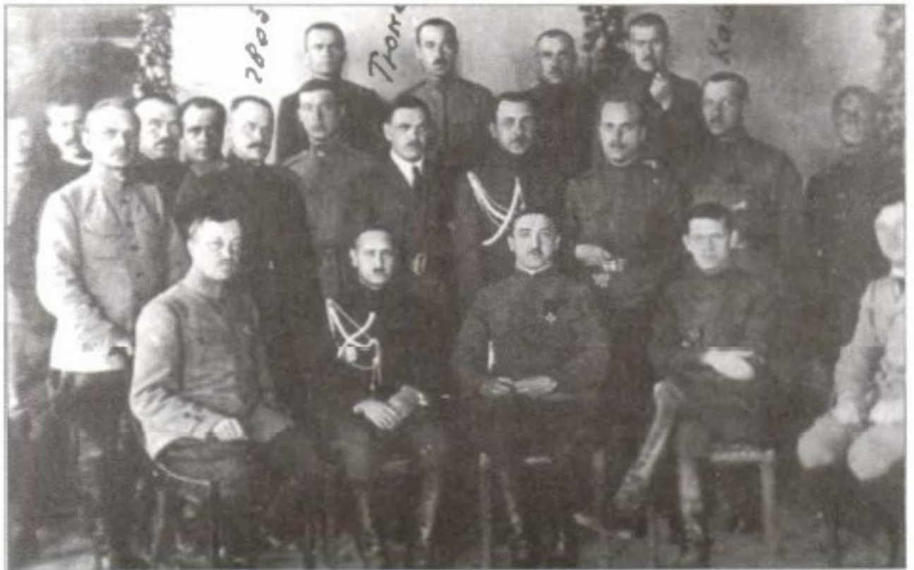
Руководители Комуча. Самара. 1918 г.