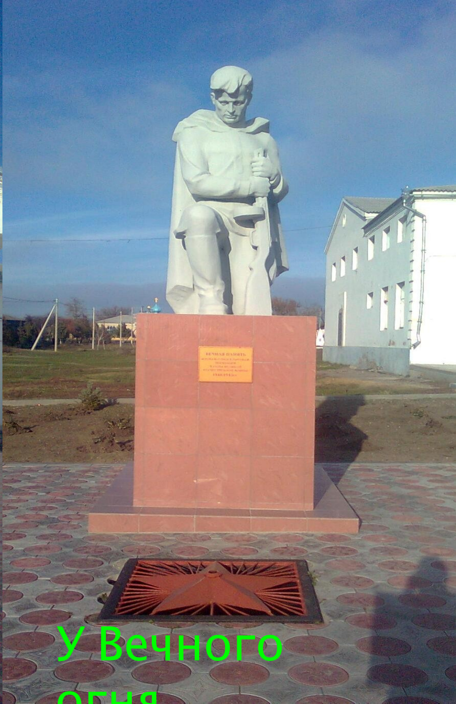
У Вечного огня