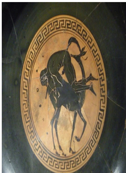
[ Б 2 ]