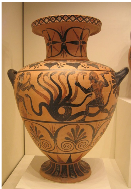
[ Б 1 ]