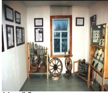
Музей Гжатского тракта