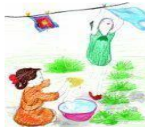
рис 6 - Хорош

садовник – хорош и крыжовник. (Будешь хорошо ухаживать – вырастет и ягода хорошая) (рис.5)