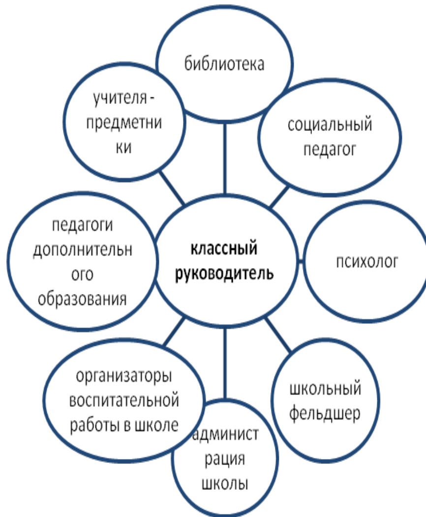
Схема взаимодействия с субъектами воспитания по реализации программы «Первые ступеньки»