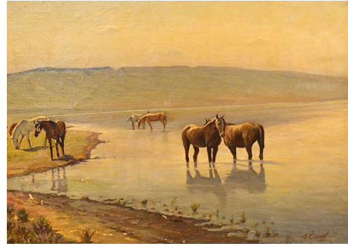
В.Г. Клёнов «На водопое»

В январские дни 1943 года В. Г. Клёновым была исполнена карандашом и тушью серия городских рисунков, изображающих г. Ставрополь в руинах и пламени. Запечатлены разрушенные резервуар водопровода, мельница, взорванные здания крайдрамтеатра, городской электростанции, «Пассажа». Таким предстает перед нами израненный войной Ставрополь.