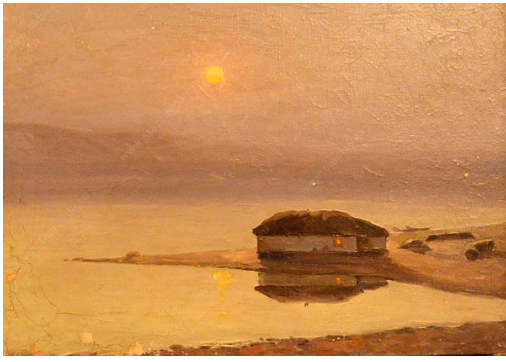
В.Г. Клёнов «Рыбачий домик»