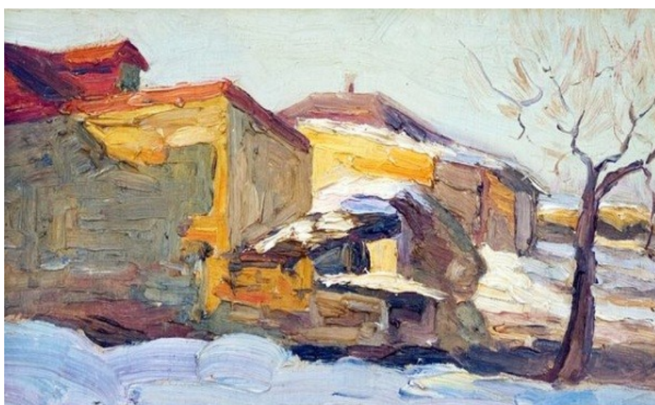
В.Г. Клёнов «Задворки»