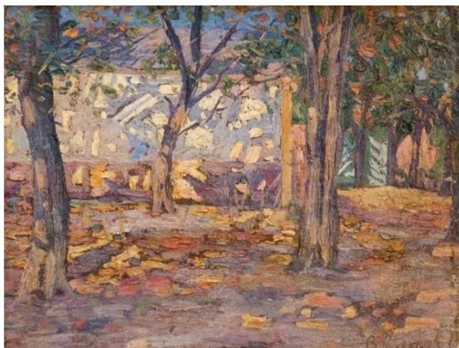
В.Г. Клёнов «Солнечный день»

В пейзажах «Дворик», «Знойный вечер», «Вечер на Сенгилеевском озере», «Вечер в степи», «Лунная ночь в Бешпагире», «Рыбачий домик», «Осень», «Последний снег», «Лошади на водопое», «Осень. Село Татарка», «Степь Ставропольская», «Осенний пейзаж» художник передает не только изображение того или иного уголка природы, а пытается понять то чувство одухотворенности, которое возникает при соприкосновении с природой.