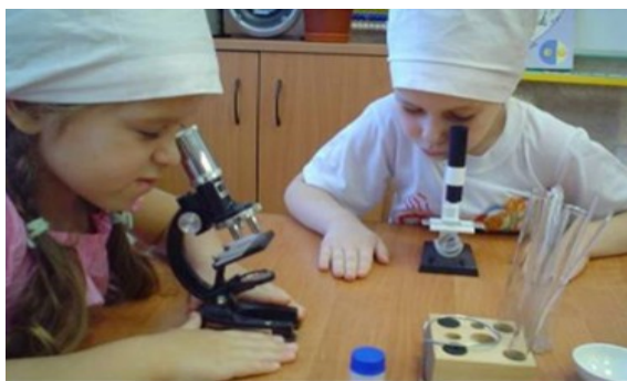
Рисунок 5 «Изучение внутреннего строения лука с помощью микроскопа»