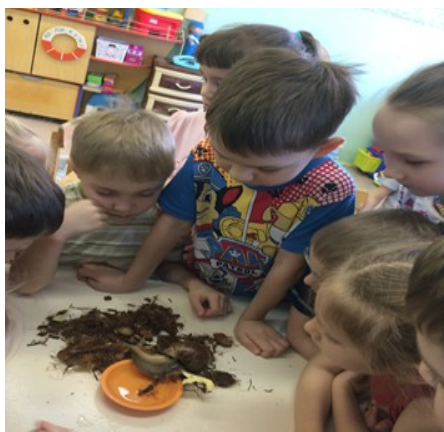
Рисунок 8 «Изучение строения моллюска и его образа жизни»