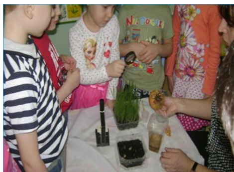
Рисунок 6 «Изучение внешнего строения лука»

Коллективное наблюдение за живой и неживой природой помогло в индивидуальной работе каждому ребенку, целевые экскурсии (в огород нашего детского сада) формируют у ребенка креативное мышление.