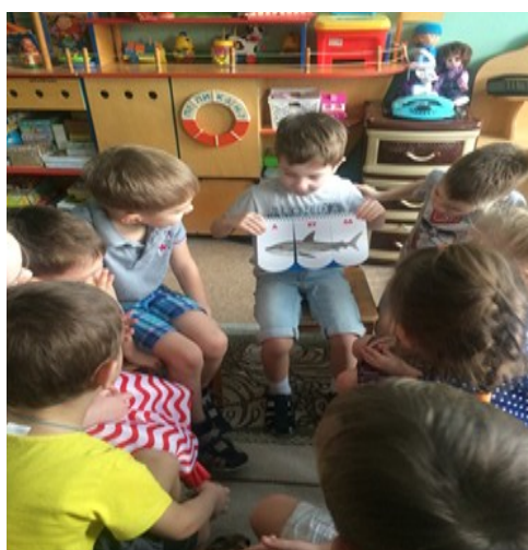
Рисунок 7 «Изучение строения животного»

Например, при проведении экспериментирования с растениями по темам «Какое значение имеет вода, кислород и почва для жизни растений?» Находили ответ, что растение нормально растет и развивается в том случае, если в корни растения будут поступать вода и все питательные вещества, а кислород нужен для дыхания всем живым существам: растениям, животным, человеку. При классификации групп животных мы раскрывали связь между строением животного и его образом жизни.