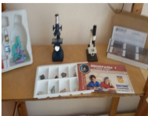
Рисунок №1 «приборы и материалы»

Из хода реализации проекта возникают вопросы, требующие раскрытия связи между живой и неживой природой: это солнце, вода, земля, воздух, растения животные. Для того, чтобы понять эту связь, в начале создали лабораторию «Почемучка», в который вошли образцы песка, глины, минералов, пробирки, лупы, весы, емкости, магнит, спринцовки, а также природный материал.