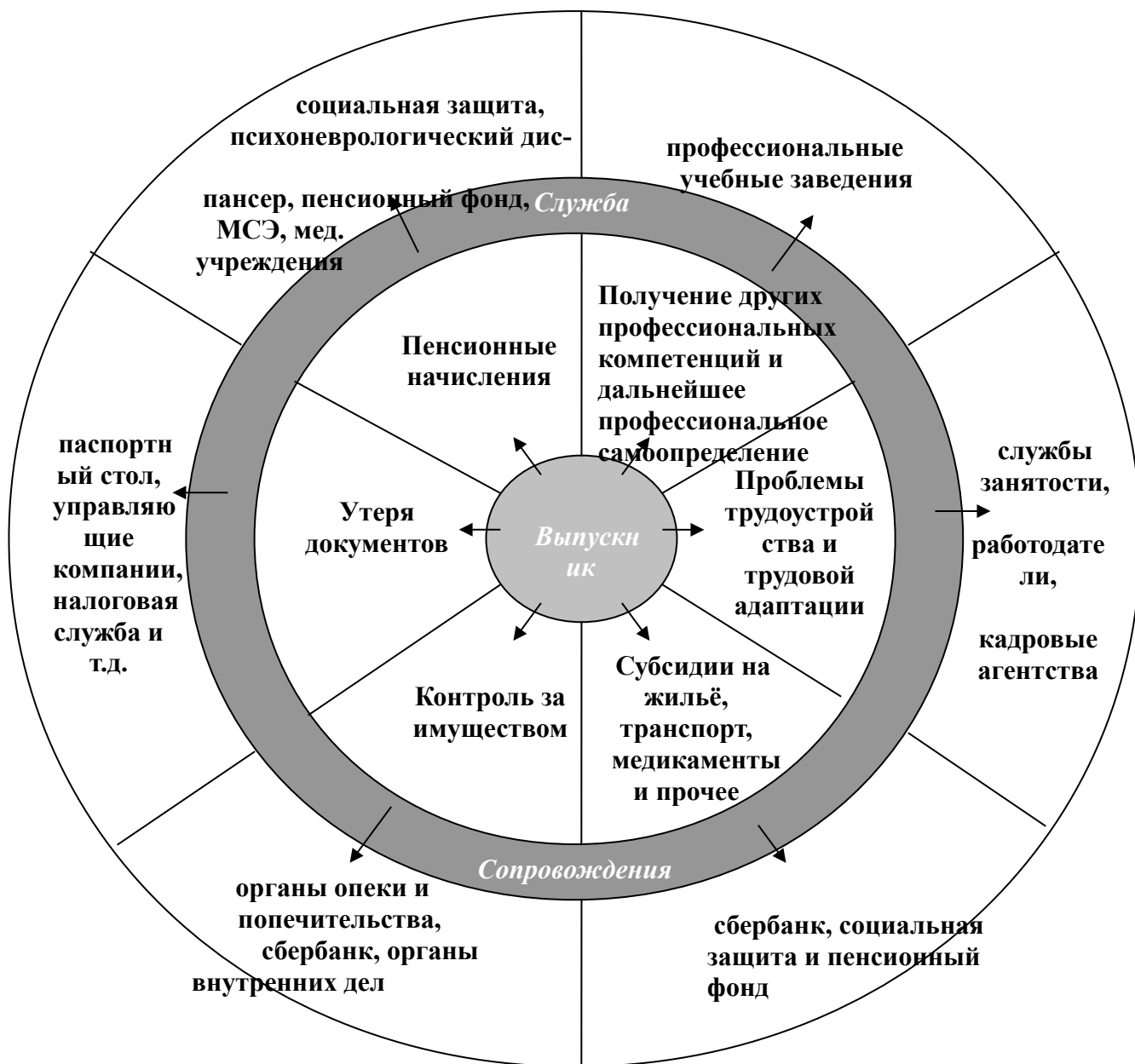
Модель наблюдательного сопровождения